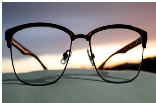
Hij / Ze draagt een bril