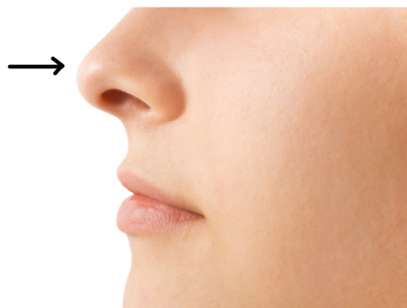
Ze heeft een kleine neus