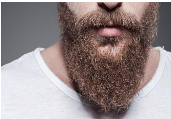
Hij heeft een baard