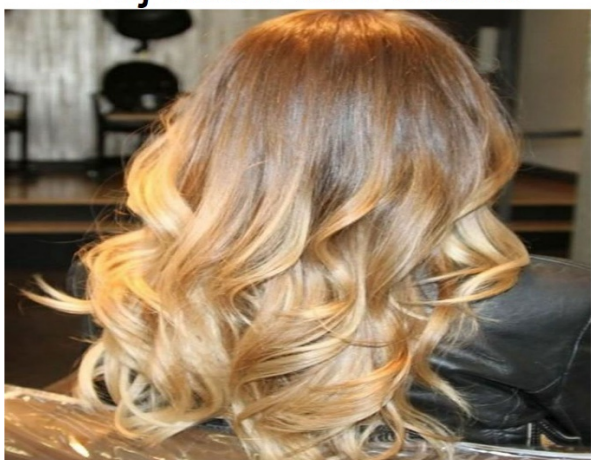
Ze heeft lang blond haar